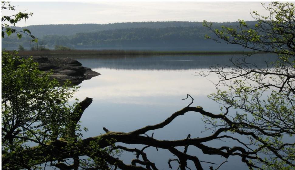
Vid Lygnerns norra strand