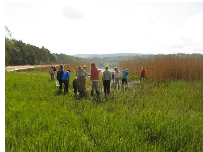
Skolklass håvar vattendjur i Lygnern

Vi stöttar också Viskans och Lygnerns vattenråds arbete med att förbättra vattenkvalitet och ekosystemen i vattnet. Vattenråden är mötesplatser för kommuner, företag och olika föreningar där man försöker få en helhetssyn på hela vattensystemet över kommun- och länsgränser. Lygnerns vattenråd har arbetat med Vattnet i skolan längs Storån och Lygnern. Detta är arbeten som Naturskyddsföreningen tycker är viktigt och gärna ser att det utvecklas vidare.